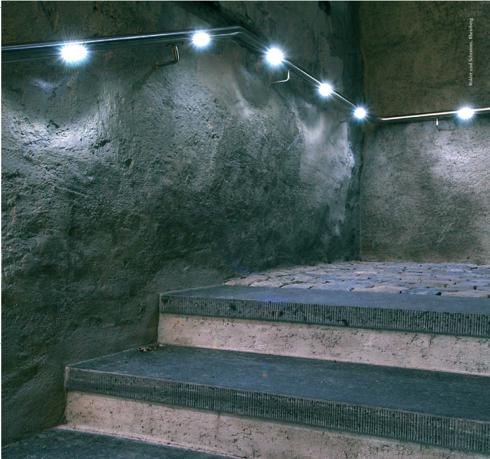
Ridder und Schramm, Rheinberg